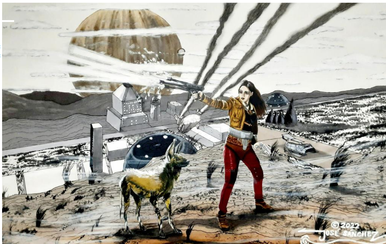
Jose Sanchez: Futurescape 2